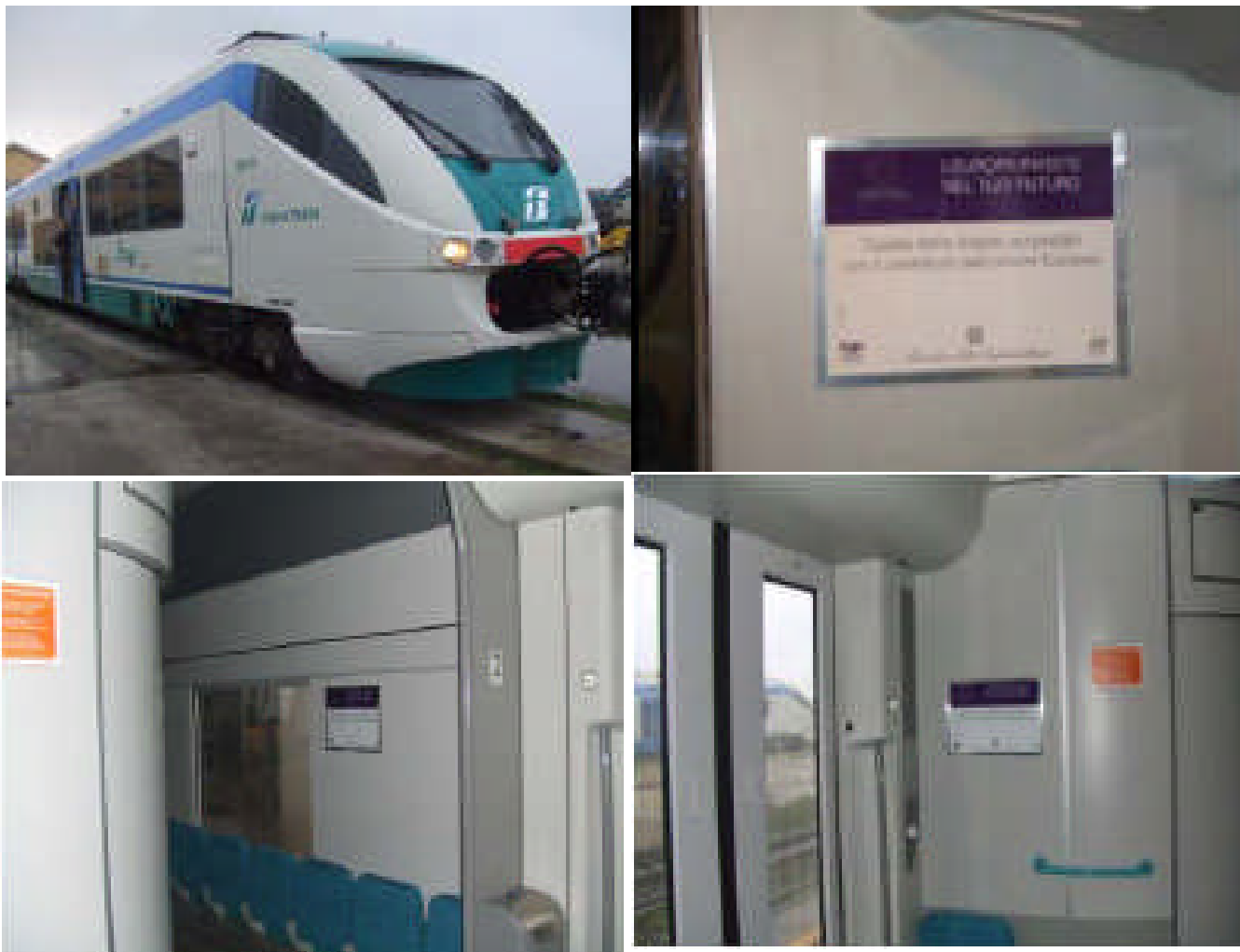
Treno Minuetto Area Vasta di Cagliari