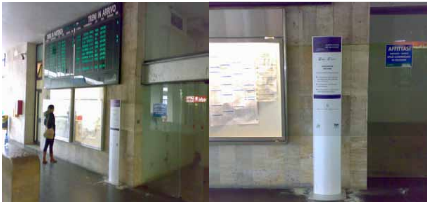
Stazione di Messina