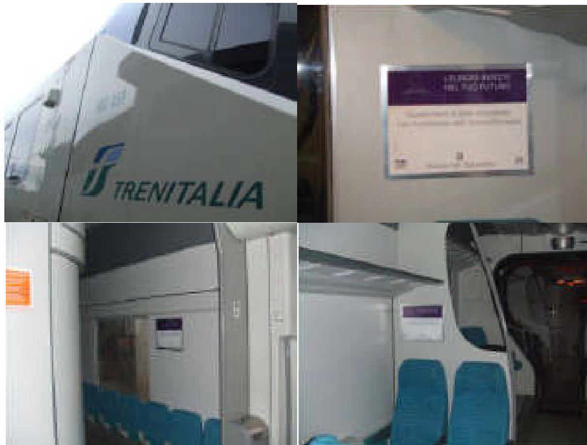
Treno Minuetto Area Vasta di Cagliari