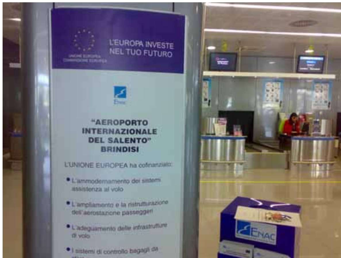
Aeroporto di Brindisi