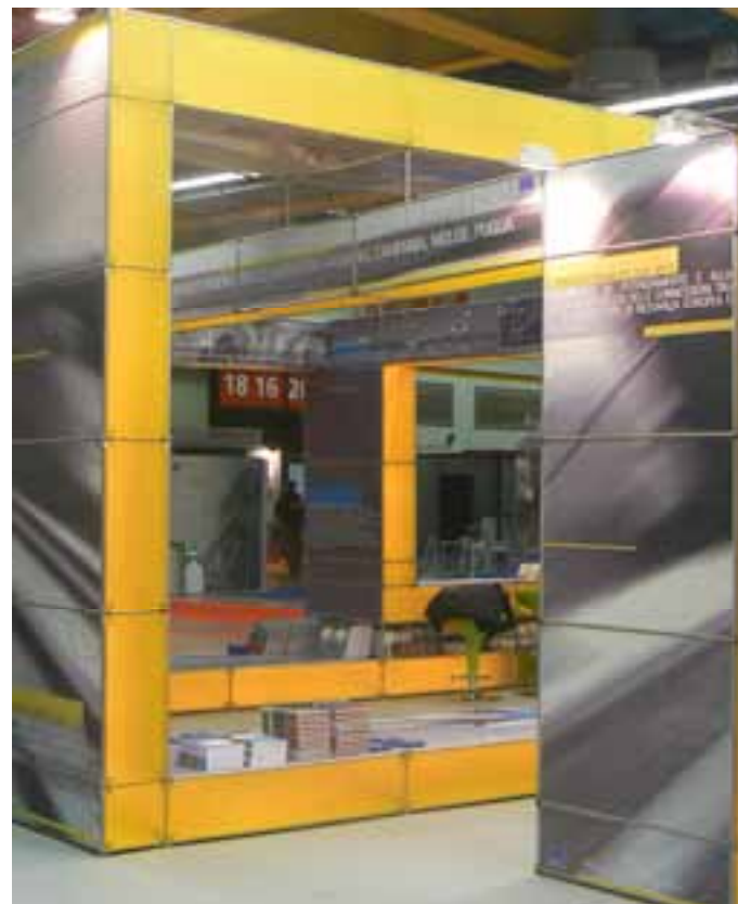
Nuovo stand del PON Trasporti 2000/2006 al COM-PA 2007