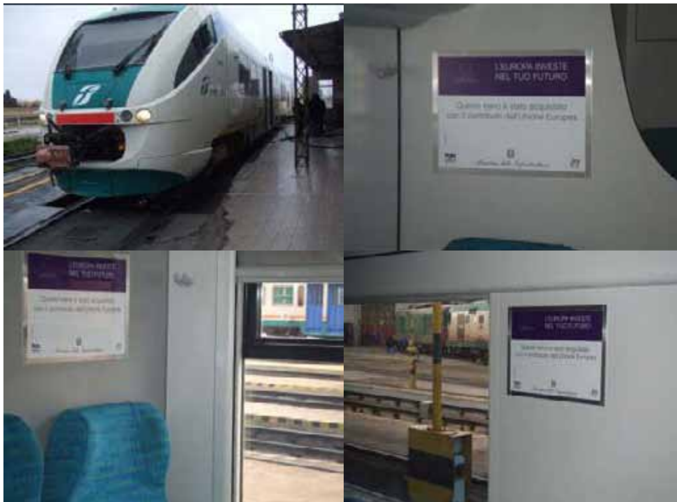
Treno Minuetto Area Vasta di Cagliari