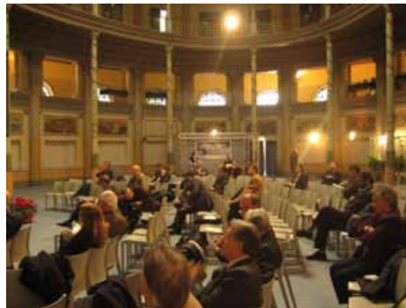
Punto Informativo del PON Trasporti 2000/2006 al Convegno AIIT