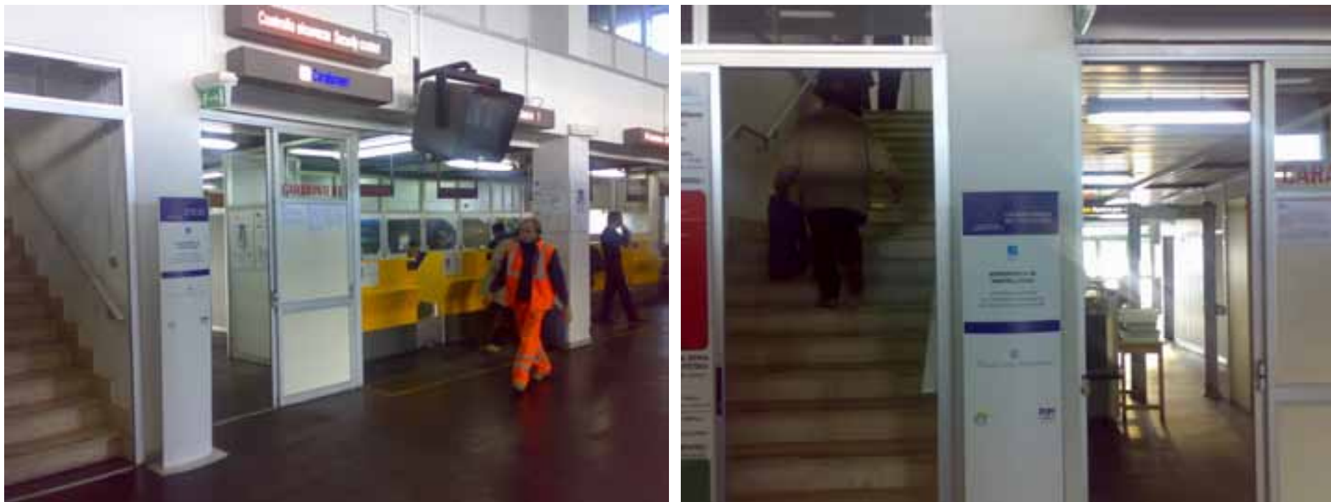
Aeroporto di Pantelleria