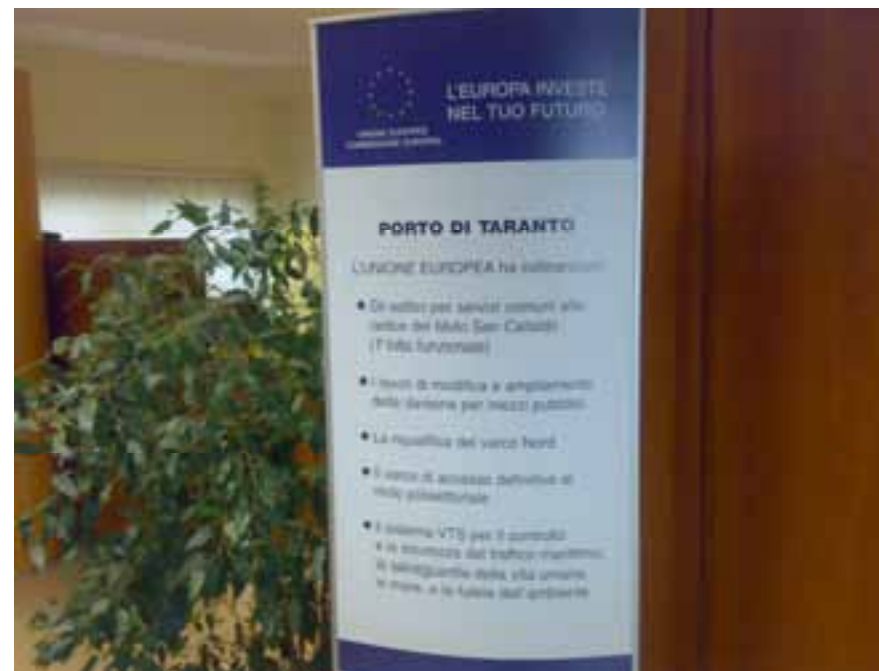
Porto di Taranto

Le immagini dei totem installati sono visibili sul sito www.infrastrutture.gov.it/pontrasporti nella sezione “Obblighi di informazione e pubblicità”.