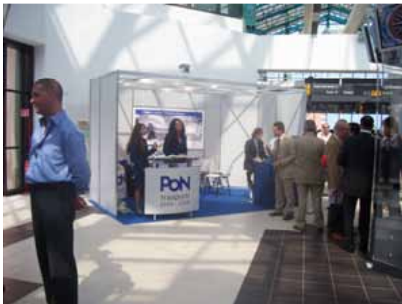
Punto Informativo del PON Trasporti 2000/2006 al Convegno SIIV

IV Convegno Internazionale della Società Italiana Infrastrutture Viarie (SIIV), tenutosi presso l'Università degli Studi di Palermo