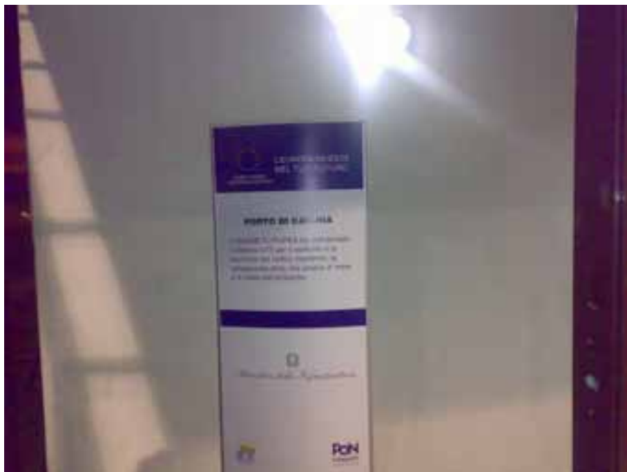
Porto di Catania