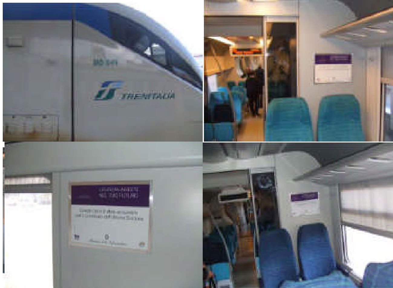
Treno Minuetto Area Vasta di Cagliari