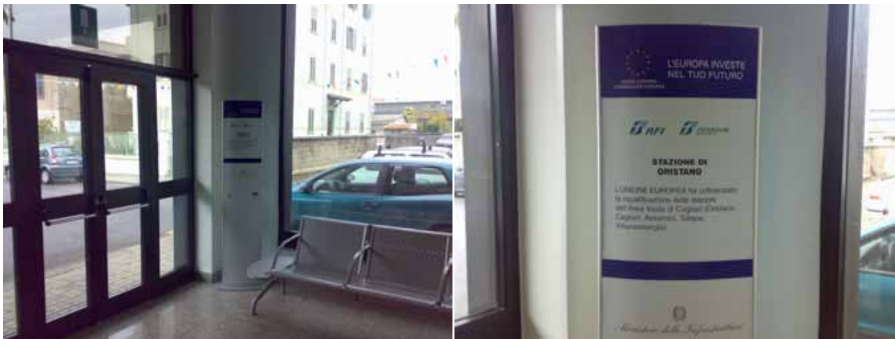
Stazione di Oristano