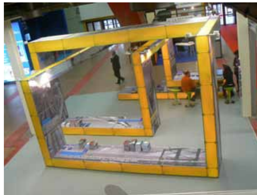
Nuovo stand del PON Trasporti 2000/2006 al COM-PA 2007