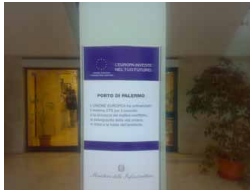
Porto di Palermo