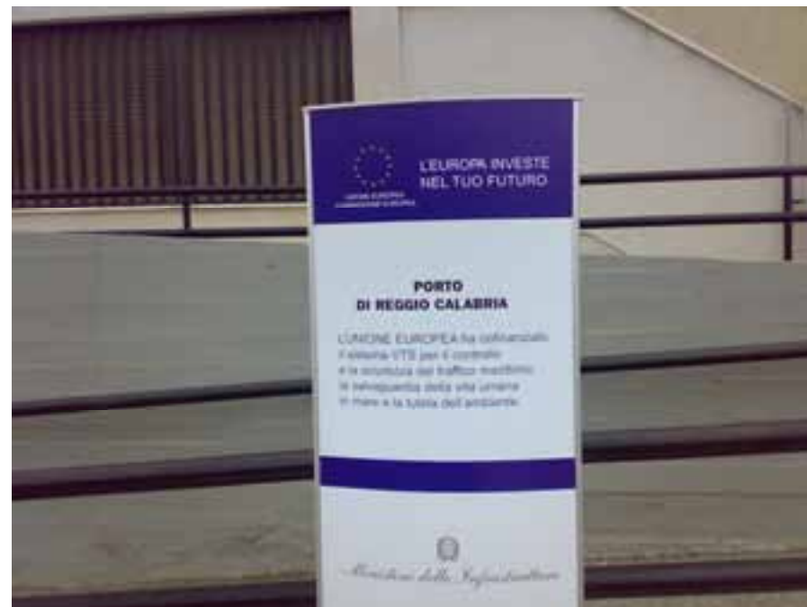
Porto di Reggio Calabria