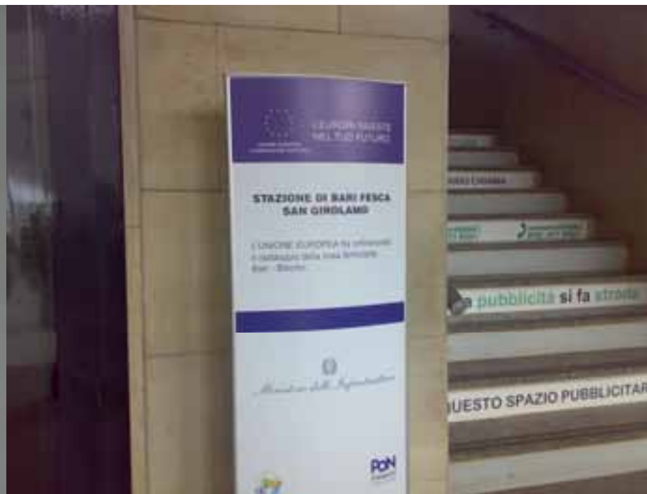
Stazione di Bari Fesca - San Girolamo