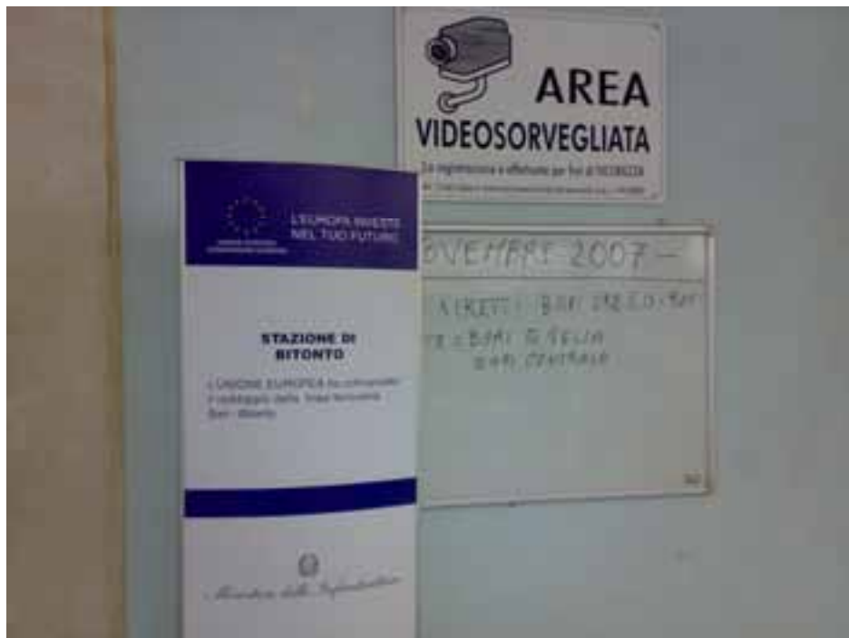
Stazione di Bitonto