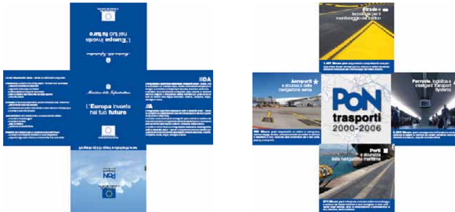
Layout nuovo depliant